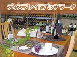
ディスプレイ/パッチワーク