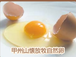
甲州山懐放牧自然卵