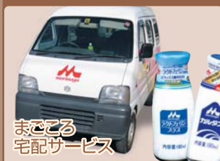
まごころ 宅配サービス