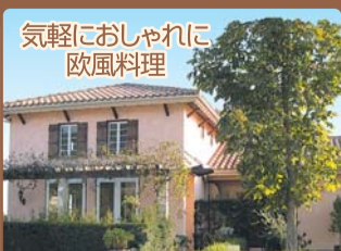
気軽におしゃれに 欧風料理